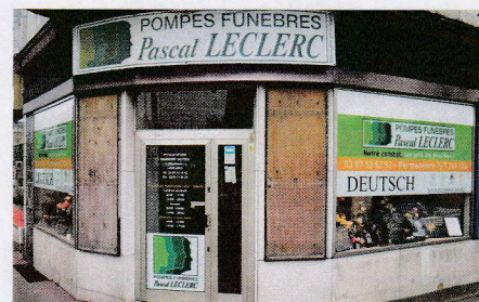
Pompes Funèbres Pascal Leclerc - 31, rue Clovis