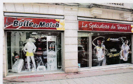
BALLE DE MATCH - 16, rue du Sablon