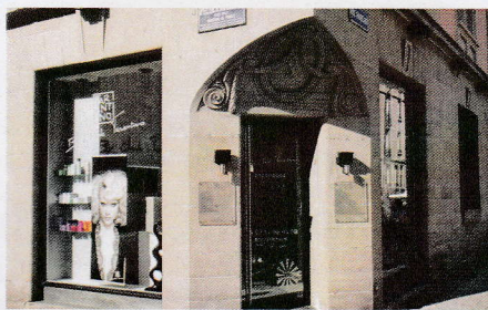
By Tarantino - 17, av. Leclerc de Hautesclocque