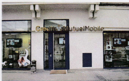
Crédit Mutuel Mobile - 12, rue F. de Curel