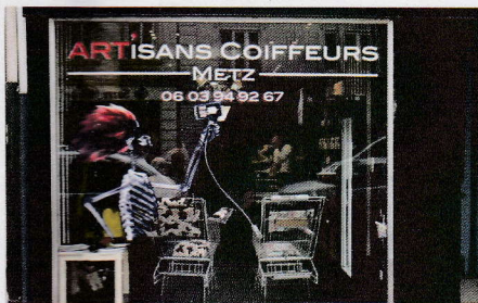
Artisans Coiffeurs - 24 rue du Sablon