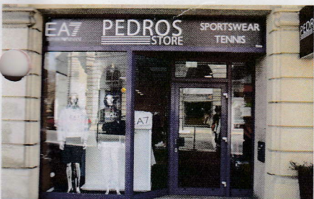
Pedros Store - 2, rue Harelle