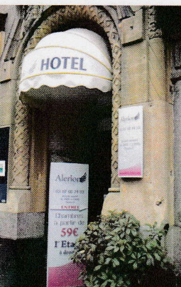
HOTEL ALERION 20, rue Gambetta