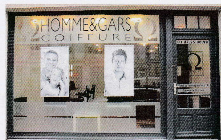
Hommes et Gars Coiffure - 28, rue Pasteur