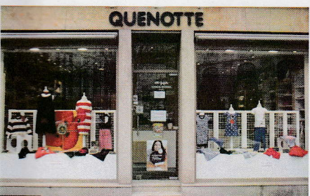
QUENOTTE - 14, rue du Sablon