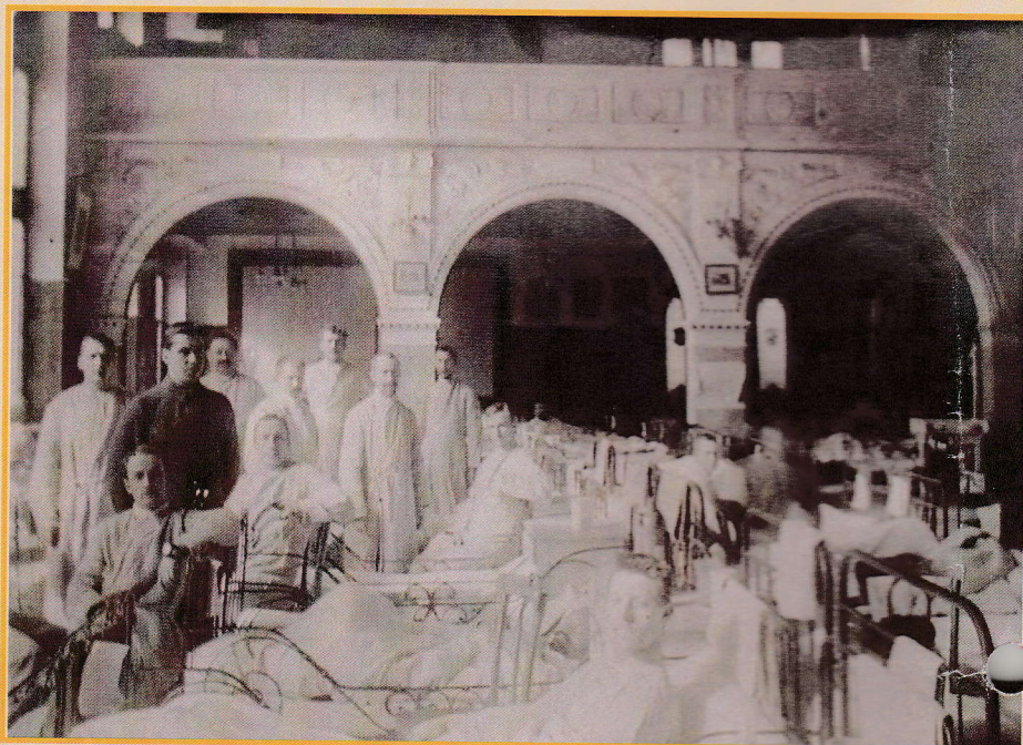
Salle de cinéma, autrefois un hôpital durant la guerre de 1914-18

Malgré d'innombrables difficultés de financement et la demande de la construction d'arcades (exigées par Conrad Wahn), les travaux furent achevés le 22 septembre 1909.