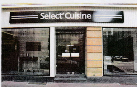
Select Cuisine - 9, rue Pasteur