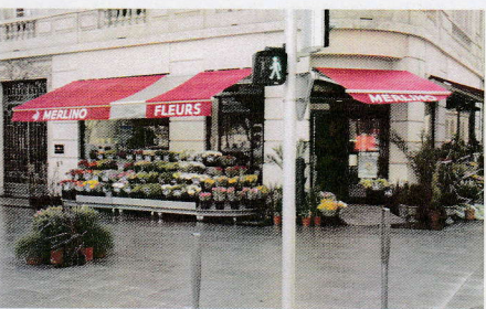
Merlino - 2, place Raymond Mondon