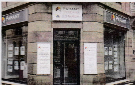
Parant Immobilier - 4-8, rue Henri Maret