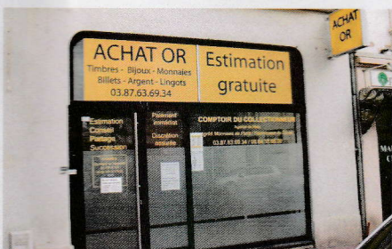
COMPTOIR DU COLLECTIONNEUR - 20, rue du Sablon